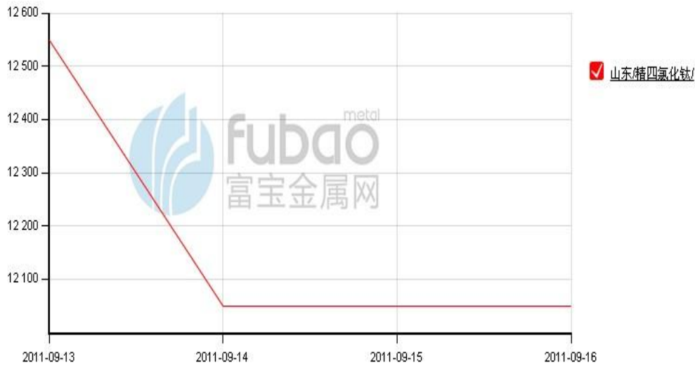
图1 山东精四氯化钛价格走势（单位：元/吨）

据了解，近期受下游海绵钛市场弱势，成交量少，产量减少影响，国内精四氯化钛市场也在走弱，本周其价格又有下调，目前各地四氯化钛价格在 1.18-1.22 万元/吨左右。价格虽降低，但下游采购需求依然保持清冷，因此，四氯化钛厂正在减产，各地厂家停产诸多。