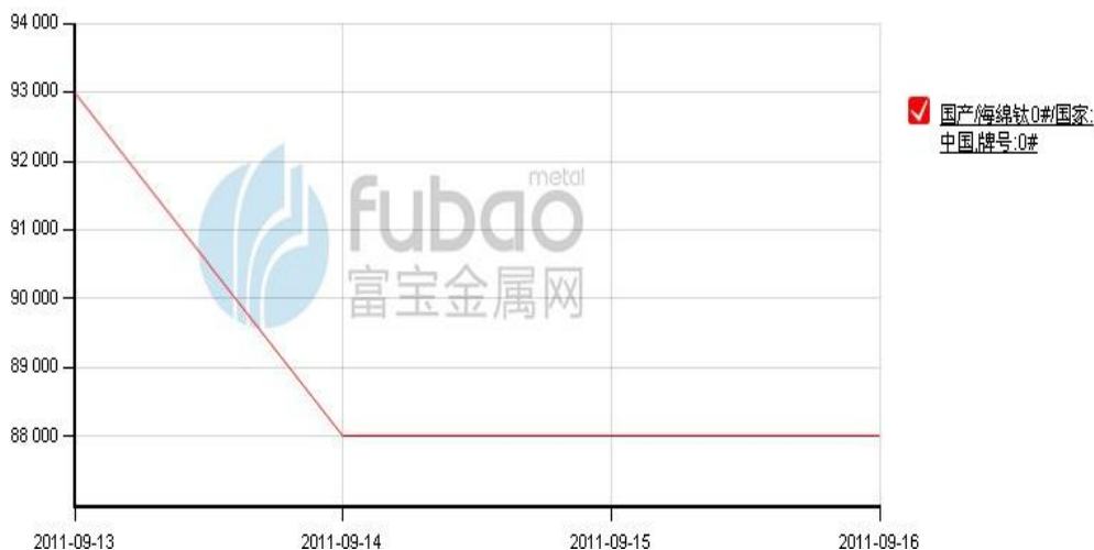
图2 国内主要地区海绵钛价格走势（单位：元/吨）

本周海绵钛市场混乱，海绵钛大厂报价 0#海绵钛在 8.55 万元/吨左右，而据市场反映，目前下游钛材市场虽有好转，相比 8 月、9 月销售量有所加大，但其对海绵钛市场的影响并不明显，海绵钛价格依然弱势。