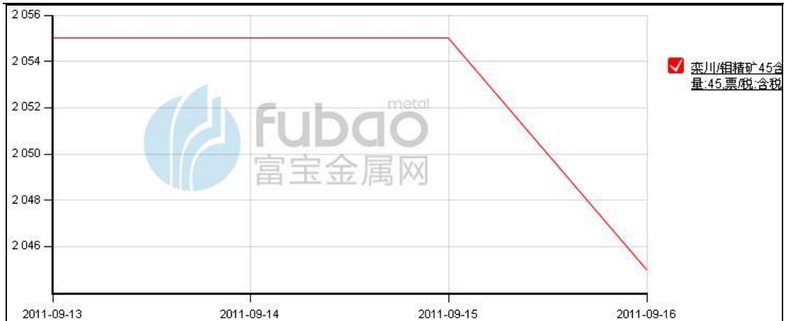
图 1: 栾川地区钼精矿价格 (单位: 元/吨度)

从图 1 可以看出: 9 月第二周栾川地区钼精矿价格下跌, 预计 9 月第三周将会维持平稳走势, 预期在 2030 元/吨度附近。