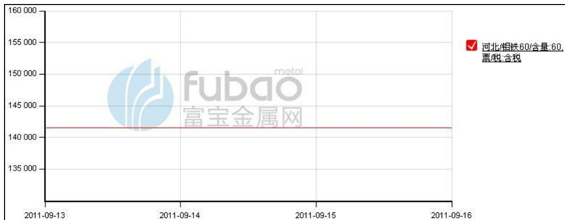
图 2: 河北地区钼铁价格 (单位: 元/基吨)

9 月第二周国内钼铁价格企稳, 钢厂钼铁招标量较少, 市场报价坚挺, 然实际成交不畅。