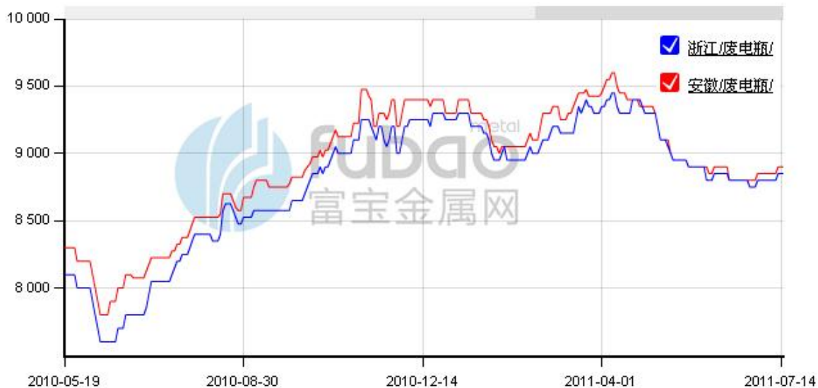
图 8：安徽、浙江废旧电瓶一周回顾