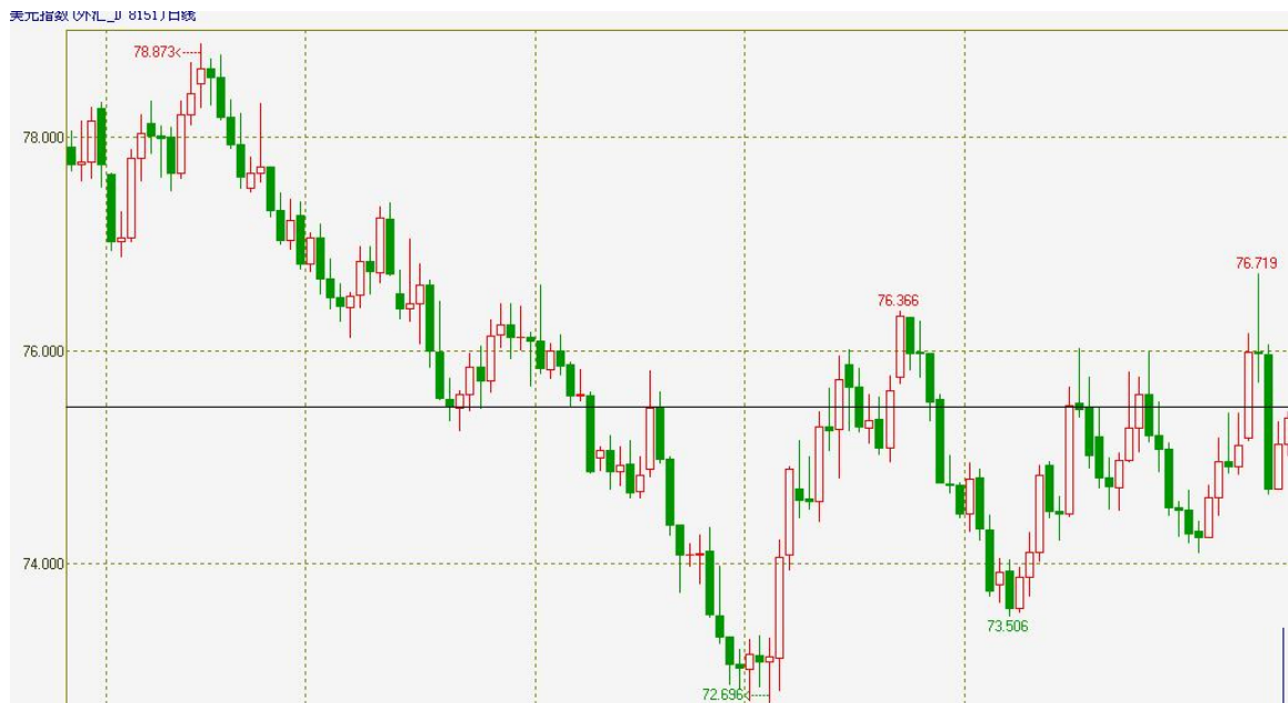
图 4：美元指数 K 线图