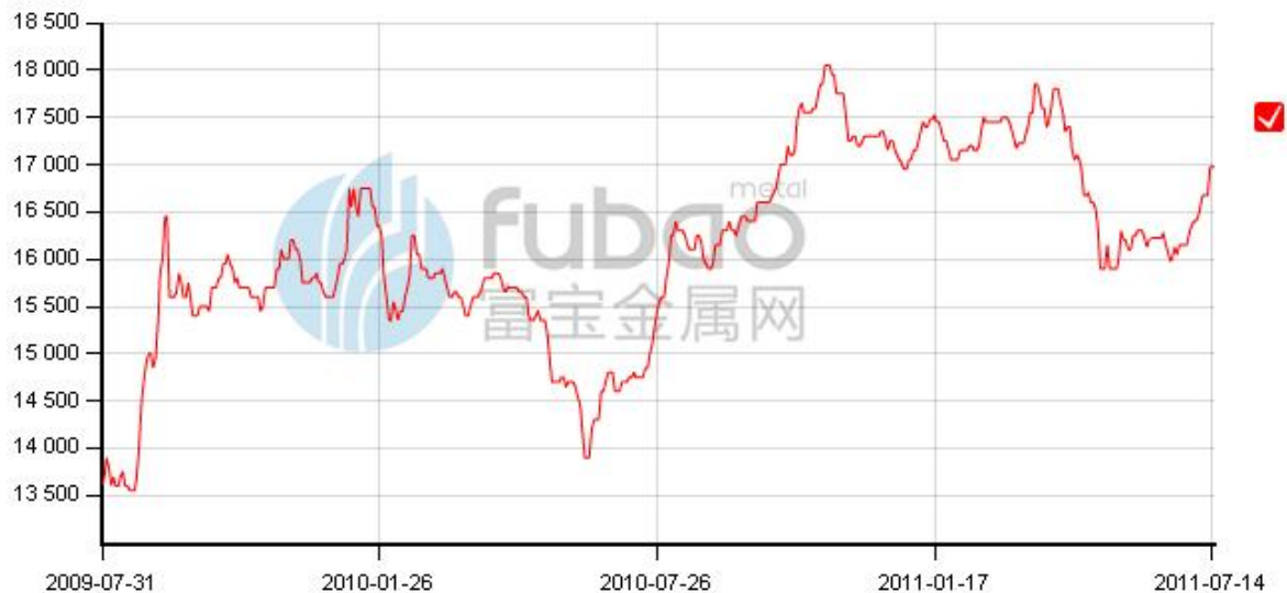
图 7：上海现货实际成交均价