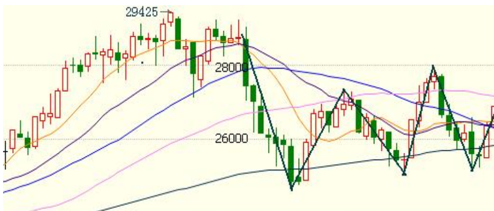
图3：伦镍日线图走势

受美元大幅回落，及库存持续减少支撑，本周伦镍在跌至25200美元附近后，强劲反弹，表现明显强于其他金属。周内最低成交价报25260美元，最高成交价报26900美元，日成交变化不大。库存减少2560吨至 117920吨。注销仓单占比维持在5%上方。