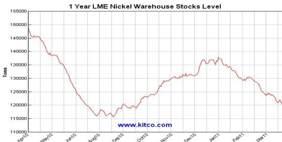
图 6：近一年来伦镍库存变化

由于投产的新矿增加，以及旧矿重新投入正常运营，2011 年全球镍市场将出现一定程度的供应过剩。由于新增产能正常运作需要时间，以及下游消费需求维持在高位，故不排除全球镍出现阶段性供应缺口的可能。本周，世界金属统计局公布数据显示，2011 年前两个月全球镍市场共出现 3700 吨的供应缺口。这与今年以来伦镍库存持续减少交相呼应，进入三月份注销仓单占比一直维持在 5% 上方，较高时甚至增加至 8% 附近。根据近期国际各大镍矿商的运营情况来看，整个上半年全球镍市场出现供应缺口的可能较大。