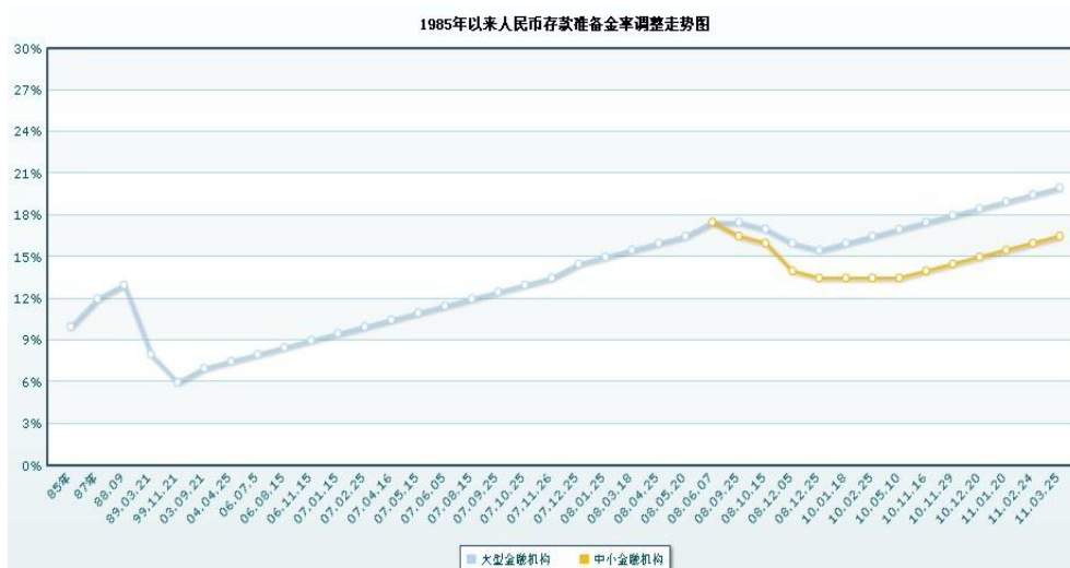
图 1：人民币存款准备金率调整走势图

上周末，中国人民银行上调存款准备金率 50 个基点，为年内第四次上调。至此，大型金融机构存款准备金率达到 20.5%，本次上调冻结资金约 3600 亿元。由于之前市场对此早已有预期，对金属影响不大。