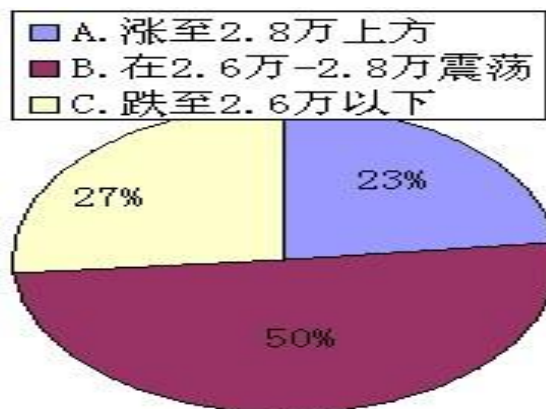
图 8: 下周伦镍走势调查