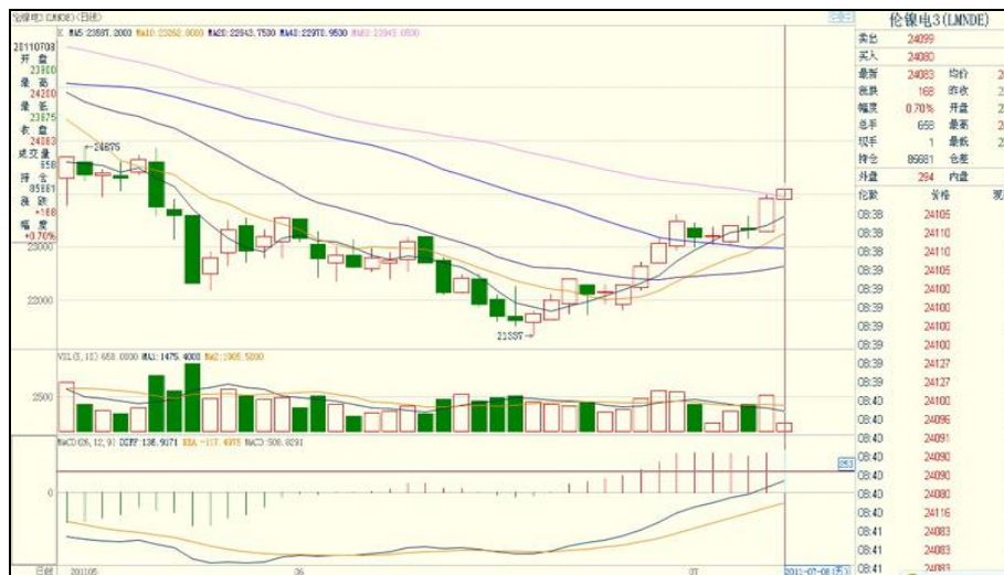
图 1：LME 镍本周市场行情走势图（单位：美元/吨）

所反复，如图 1。周二，美国休市，金融市场缺乏交投指引，伦镍在 2.3 万上方窄幅震荡，收盘微涨，短期或延续震荡。周三，中国金属需求前景乐观，伦镍收盘小涨近 200，短期或在 23000-23500 附近强势震荡。周四，穆迪下调葡萄牙评级，避险情绪升温，伦镍收盘小跌，短期继续围绕 23500 压力震荡。周末，美国就业市场趋好提振人气，并库存大减，伦镍收盘涨近 600，短期维持强势，或上试 2.4 万。截止收盘 LME 综合镍收盘 23636 美元/吨，较上周上涨 171 美元；本周伦镍均价为 169840 美元，库存 104682 吨，较上周减少 798 吨。本周欧元加息符合了市场预期，同时，美国非农就业数据公布，市场预计普遍向好，对后市走势有较大影响，注意风险。