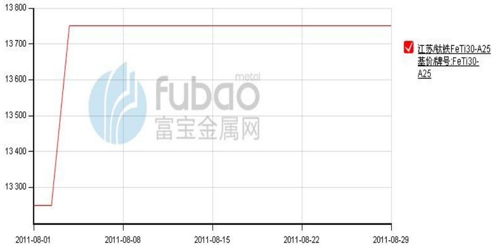
图 4：江苏低钛铁 8 月价格走势(单位：元/基吨)

本月初，进入盛夏后，各地限电，钢厂减产，令其原料需求量也减少，因此，近期国内钛铁市场需求依然清冷。但原料钛精矿价格居高，铝粉价格强势，令本已利润微薄的钛铁价格继续上行。月初低钛铁价格上调幅度在 500 元/基吨左右，总体上看，各地报价在 13800-14000 元/基吨上下。