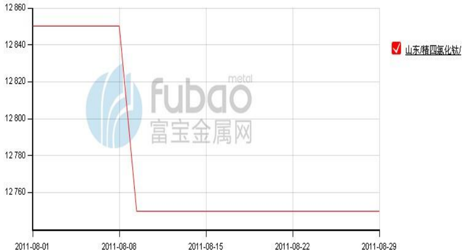
图 2：山东精四氯化钛 8 月价格走势（单位：元/吨）

本月初，伴随着钛精矿市场的趋弱，国内钛渣市场价格下跌，随后，海绵钛市场价格也继续下行。在上下游产业都弱勢的行情下，国内四氯化钛市场价格有所下跌，跌幅不大，但其本身市场供需比较平衡，成交良好，因此，其市场价格依然在 12800-12900 元/吨左右，较为坚挺，市场厂商心态较为乐观，认为后市价格有望维持平稳。