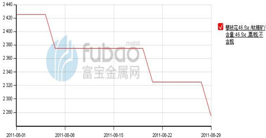
图 1：攀枝花地区 8 月钛精矿价格走势（单位：元/吨）

本月初，国内钛产品销售清冷，产量减少，也降低了对原料的采购量，令钛精矿、钛渣等市场弱势，价格下跌。月初云南钛矿、攀枝花钛精矿价格下调，下调幅度在 50 元/吨左右。