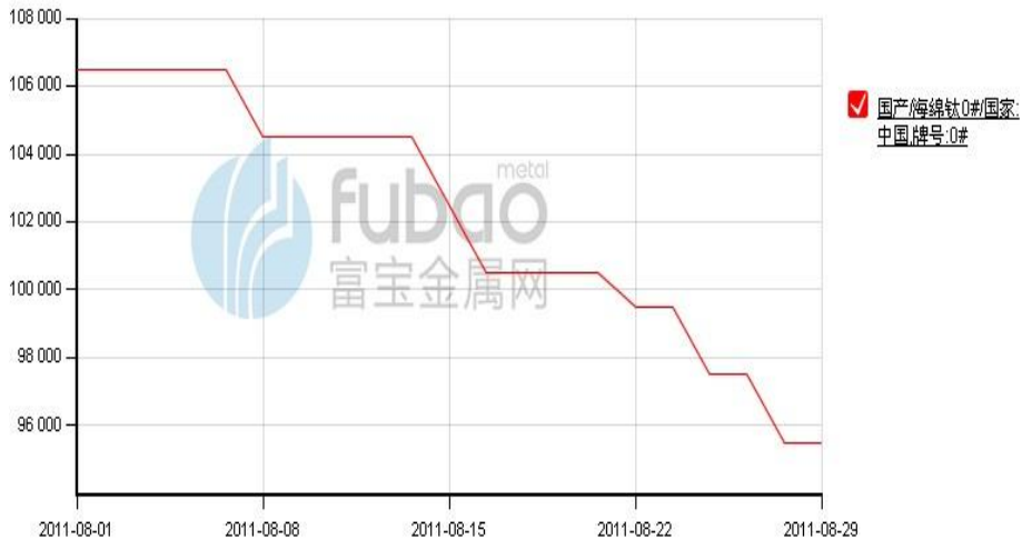
图 3：国内 0#海绵钛 8 月价格走势（单位：元/吨）

本月初，由于下游需求低迷，海绵钛成交价格下滑，市场上 1 级海绵钛成交价格已经跌落到 10 万元/吨以下。